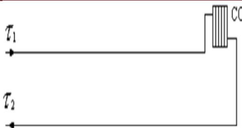
Рисунок 2 – Схема присоединения теплопотребляющих установок потребителей к тепловым сетям

с) сведения о наличии коммерческого приборного учета тепловой энергии, отпущенной из тепловых сетей потребителям, и анализ планов по установке приборов учета тепловой энергии и теплоносителя